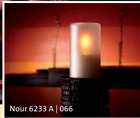
Nour 6233 A | 066

Atmosphäre entsteht durch natürliches Licht